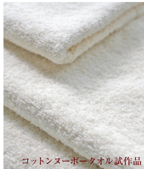
コットンヌーボータオル試作品

東京都生まれ。2009年「装苑ニューカマー」選出。2009年デザイナーズウィークコンテナアワード受賞。ELLEDECO YOUNG TARENT 受賞(iida LSP 参加)など、ジャンルを超え、これからの期待される