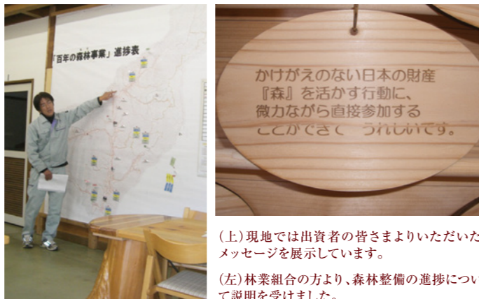
(上) 現地では出資者の皆さまよりいただいたメッセージを展示しています。

2010年11月20-21日に投資限定ツアーを開催しました。今回は、日本全国、兵庫県、秋田県、三重県、東京都から計5名が参加。林業の現場をご覧いただいたほか、きれいな森と水から生まれる美味しい食事をお楽しみいただきました。今後も、継続して実施しますので、ご参加いただければ幸いです。