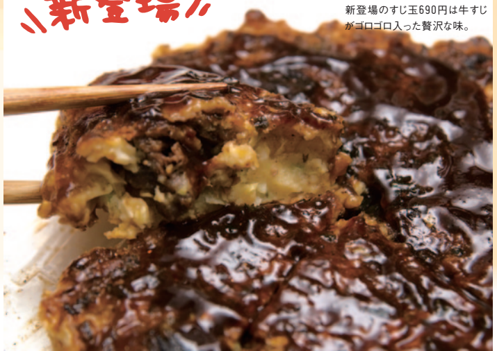
新登場のすじ玉690円は牛すじがゴロゴロ入った贅沢な味。