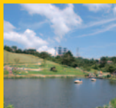
六甲山カンツリーハウス