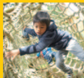
六甲山フィールド・アスレチック