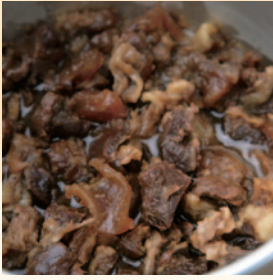
かみ切れる柔らかさまで煮込み、味がよく染み込んだ牛すじ。大ぶりがうれしい。