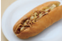
鉄板で軽く焼いたパンに、焼そばを詰め込んだ焼きそばパンも試作中。近日発売予定。