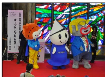
ご当地キャラ等を交えたPRステージ