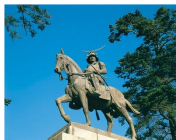
伊達政宗公 騎馬像