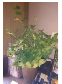
店内の花： 白やまぶき・金みずひき