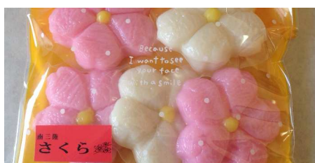
さくら 5枚入 430円(税込)

及善蒲鉾店の春を告げる蒲鉾「さくら」一つひとつ手作りして仕上げたふんわりとした蒲鉾です。春の新入学、新生活などのお祝いにかわいい細工蒲鉾さくらはいかがですか？