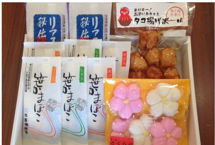
さくら咲くセット 2,300円(税込)