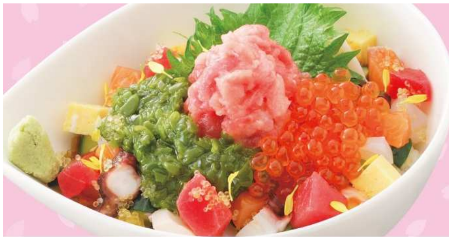
春溢れだす、彩り丼