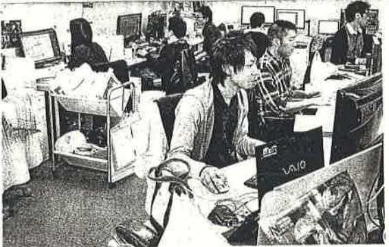
寺手クリエイターたちが活躍しているトラパンツの本社オフィス